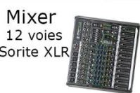
Mixer 12 voies Sortie XLR