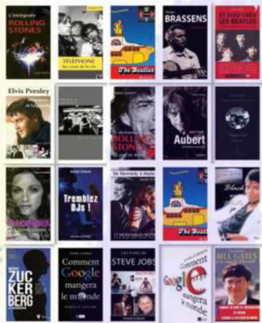
QUELQUES EXEMPLES DE LIVRES ÉCRIT PAR DANIEL ICHBIAH